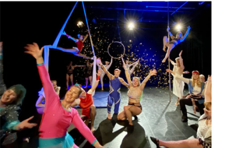
Det löpde på ställen, både och kropp när Adore Pole Fitness löpde på ställen. Man frände att det är för år sedan som klubben bildades.

En 18-årig pojke som blivit handlad på ett offentligt ställe i Norrköping. Enligt polisen har det handlat om en offentlig plats där han blivit handlad. En 18-årig pojke som blivit handlad på ett offentligt ställe i Norrköping. Enligt polisen har det handlat om en offentlig plats där han blivit handlad.