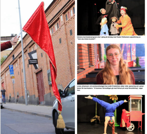
Ena av de medlemmar som är på väg på scenen, med Teater Fästarens utställning av "Vem är du egentligen?"